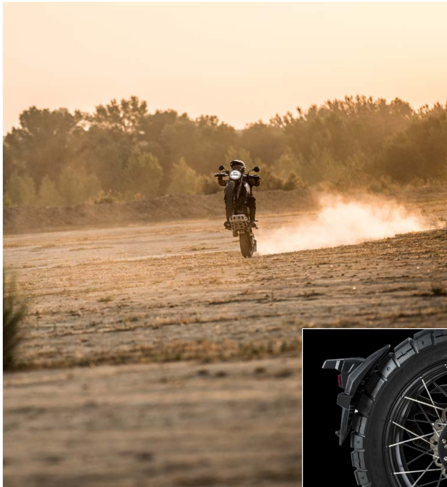
↑ Eight Mile SCR 500