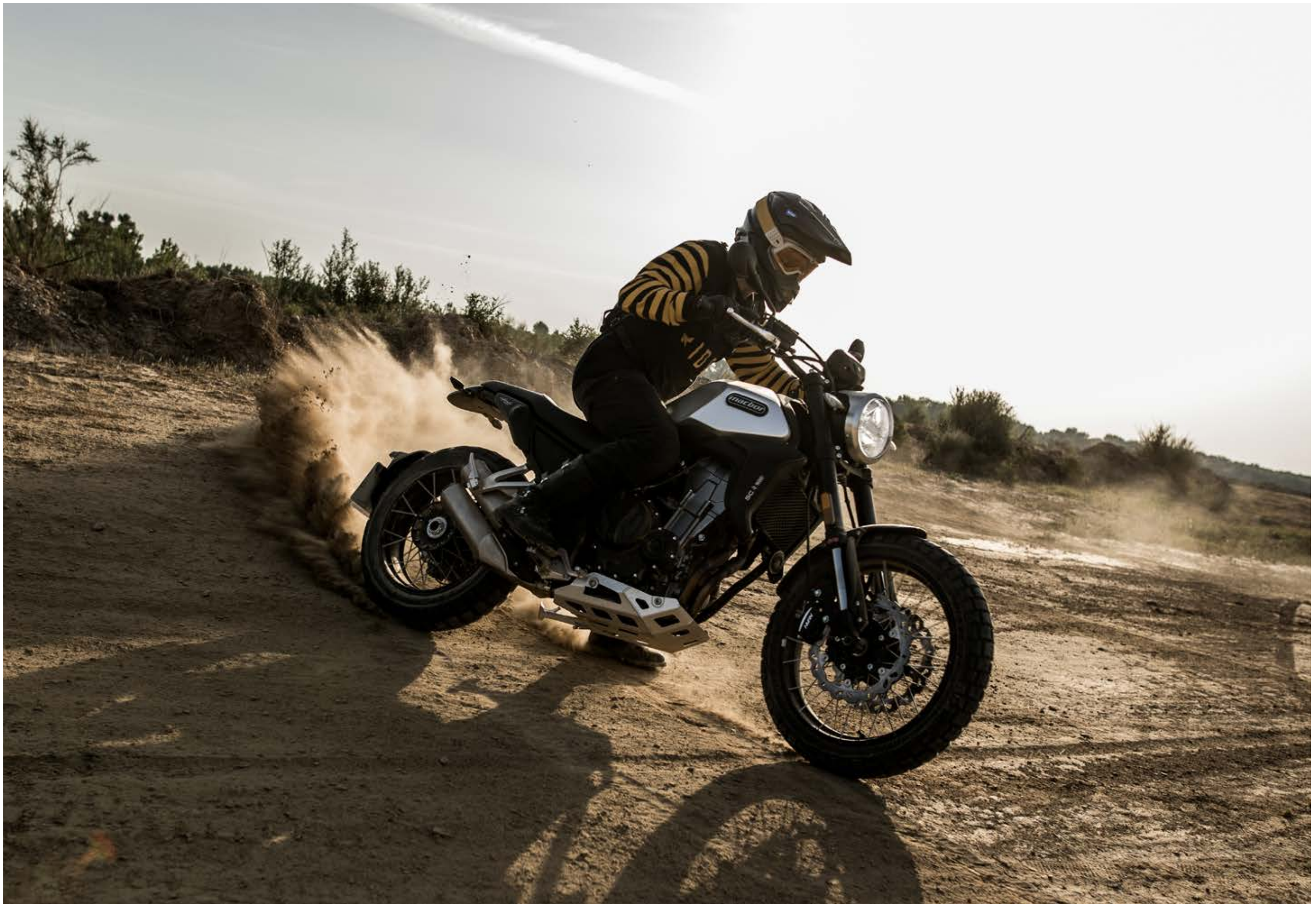
† Eight Mile SCR 500