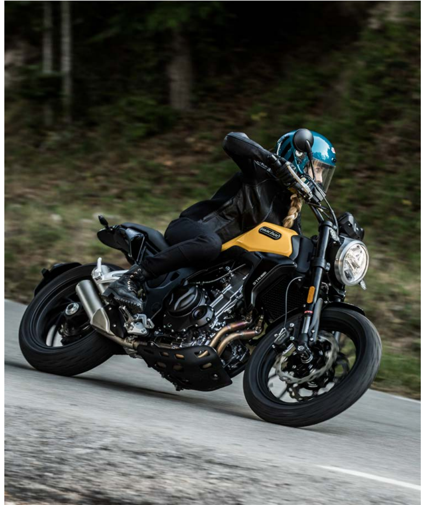
Eight Mile STR 500