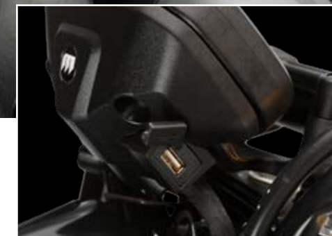
↑ Conexión USB (en ambos modelos SCR/STR 500)

TECNOLOGÍA LED, HIGH RESOLUTION, MULTICOLOR, ¿HAY OTRO MODO DE VER LA VIDA?