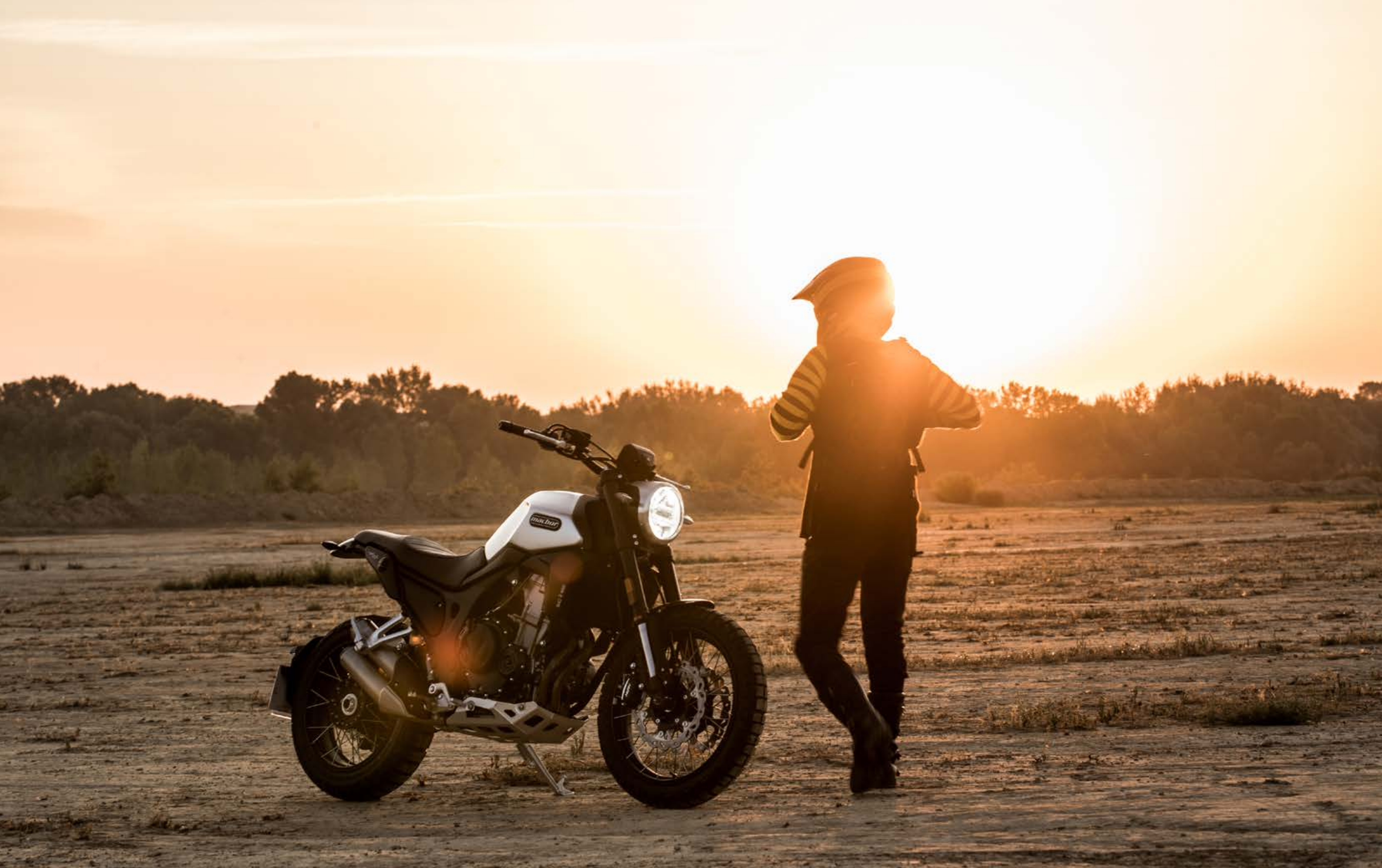
↑ Eight Mile SCR 500