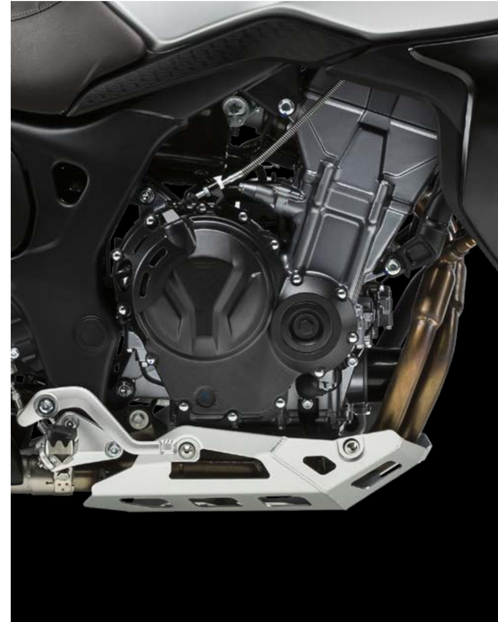
↑ Motor bicilíndrico de 471 cc (en ambos modelos SCR/STR 500)

MOTOR BICILÍNDRICO 471 CC 8 VÁLVULAS ¿YA LO SIENTES?