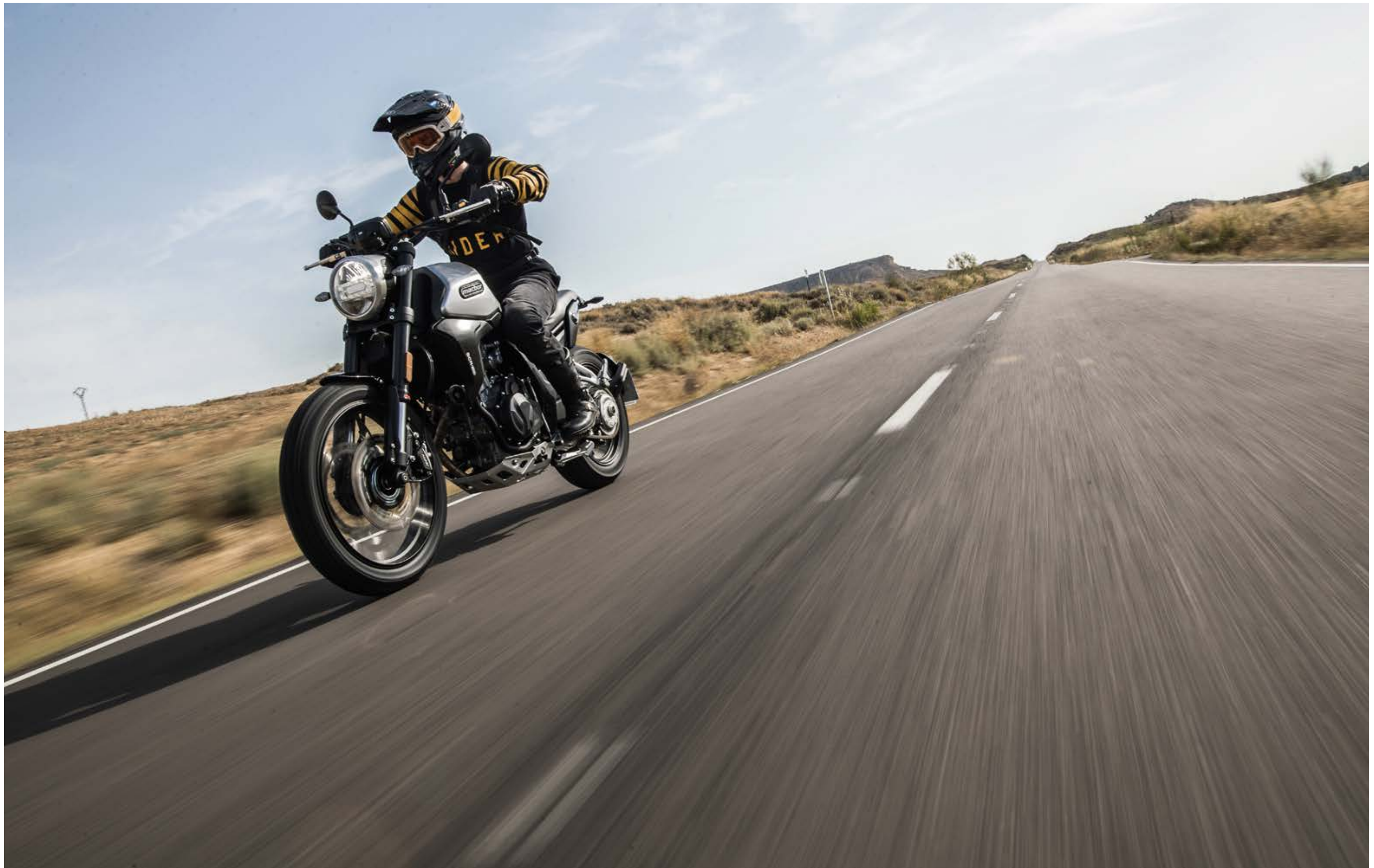
↑ Eight Mile SCR 500