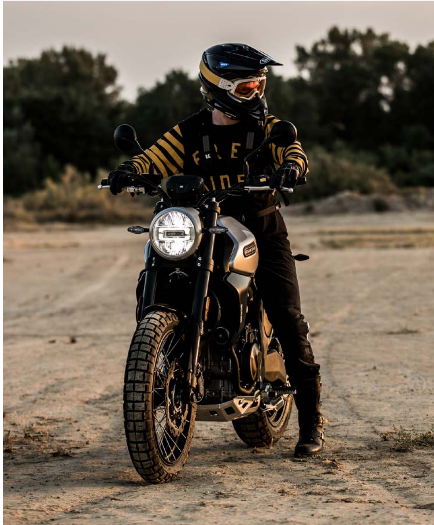
Eight Mile SCR 500