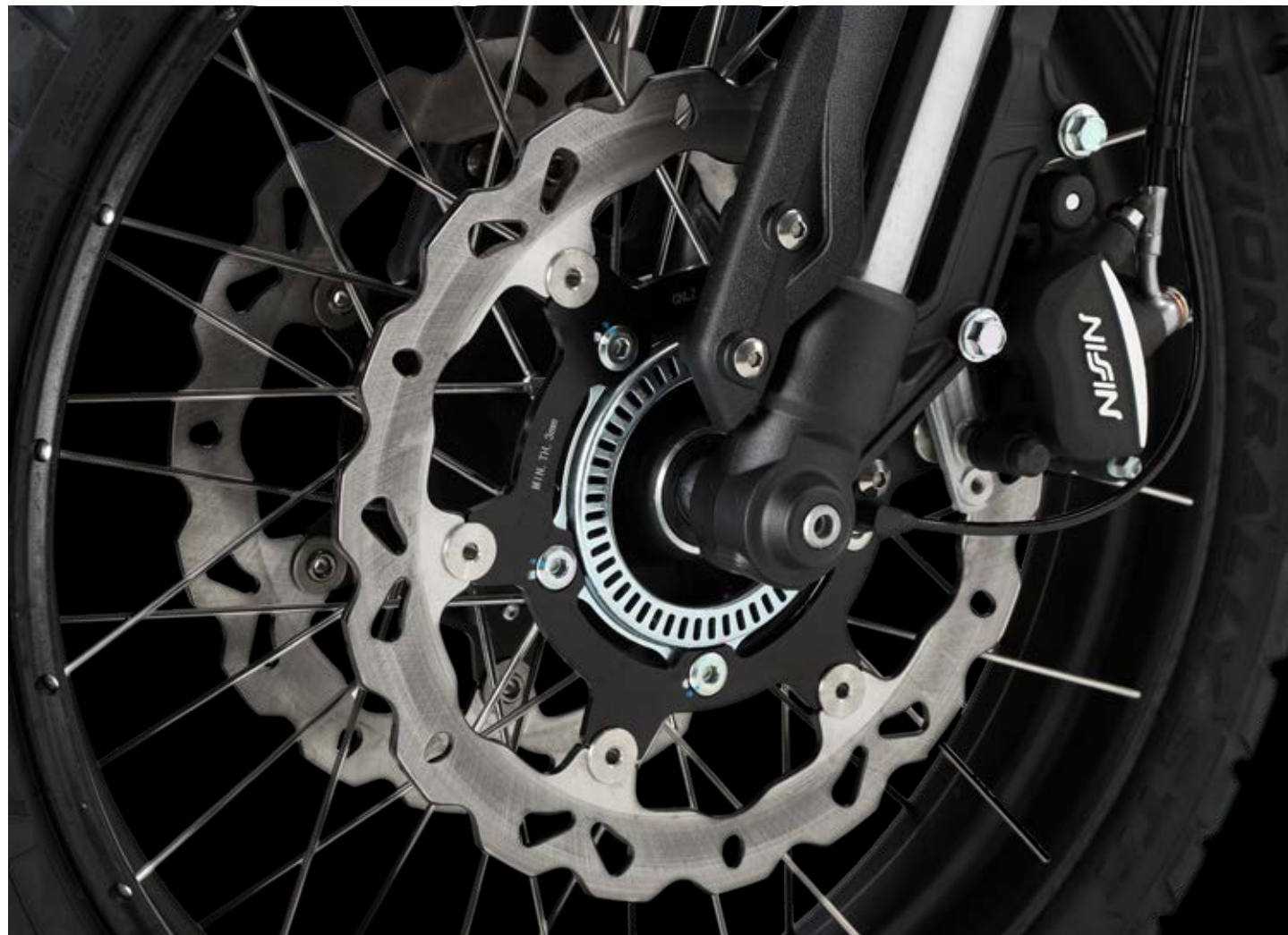
† Pinzas NISSIN (en ambos modelos SCR/STR 500)

DOBLE DISCO CON PINZA NISSIN, EL DOBLE, DE PRECISION.