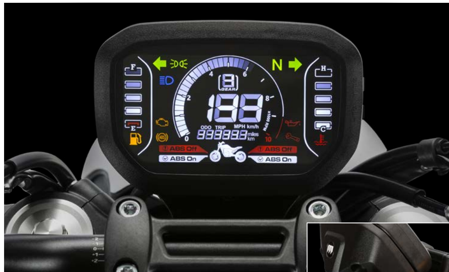
↑ Dashboard (en ambos modelos SCR/STR 500)