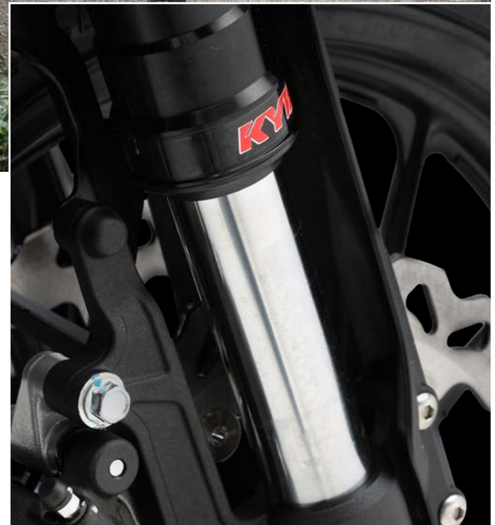
↑ Horquilla KAYABA (en ambos modelos SCR/STR 500)