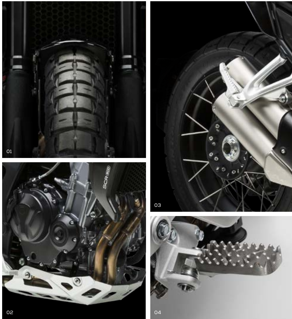
01 Neumáticos PIRELLI SCORPION RALLY 02 Protector de cárter más envolvente y en aluminio natural 03 Llantas de aluminio tubeless AKRONT con radios cruzados 04 Reposapiés con opción de goma antivibraciones removible