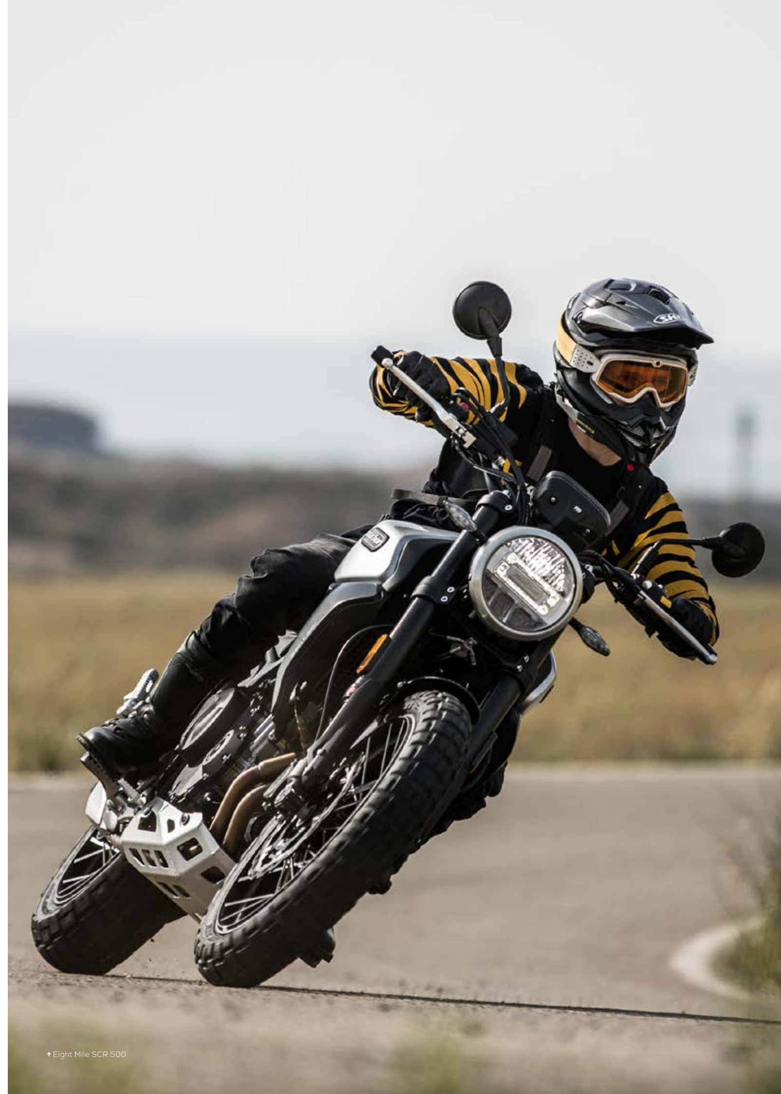
† Eight Mile SCR 500

Un buen motero sabe que no hay diversión sin seguridad. Exigimos las mejores prestaciones para poder dar rienda suelta a nuestra pasión con todas las garantías. Tú juega con las sensaciones, que nosotros controlamos el resto. Hemos equipado tu Eight Mile con freno delantero de doble disco Wave flotante de 298 mm en acero ultra ligero y pinzas de freno NISSIN con doble pistón. El freno trasero de disco Wave de 240 mm y pinza NISSIN para un control total de frenada. Y para no dejar nada al azar, ABS desconectable (ON/OFF para ambas ruedas o sólo trasera OFF). ¿Lo ves? Está todo bajo control.