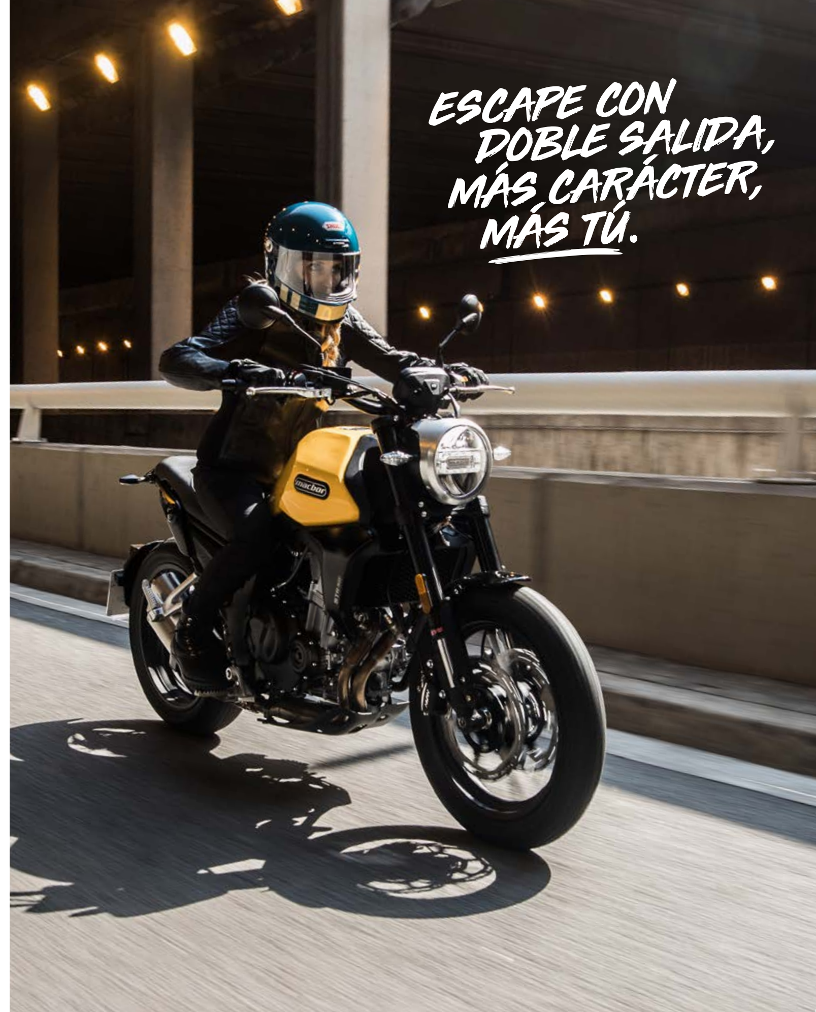
† Eight Mile STR 500

Su elegante tubo de escape con doble salida emite un rugido único y mejora el rendimiento del motor pero, sobre todo, convertirá cualquier desplazamiento en pura emoción. Naciste para impresionar; que se note.