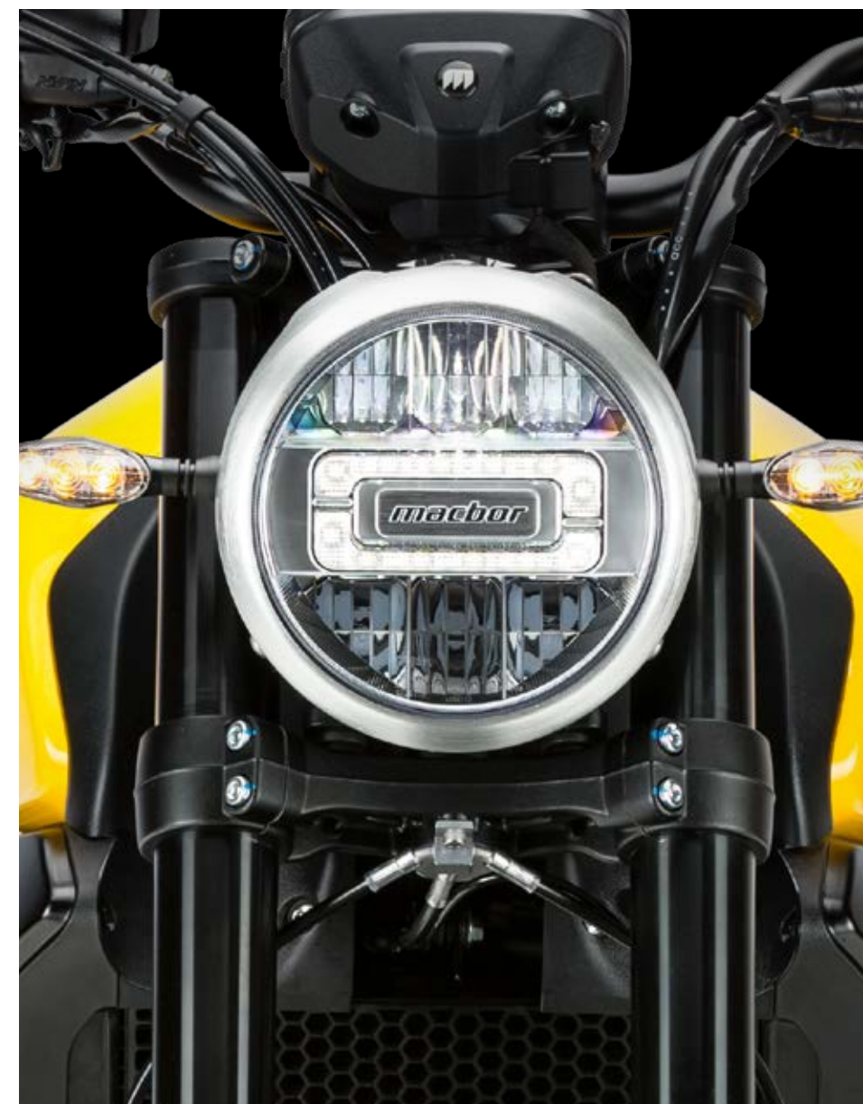
† Full LED (en ambos modelos SCR/STR 500).