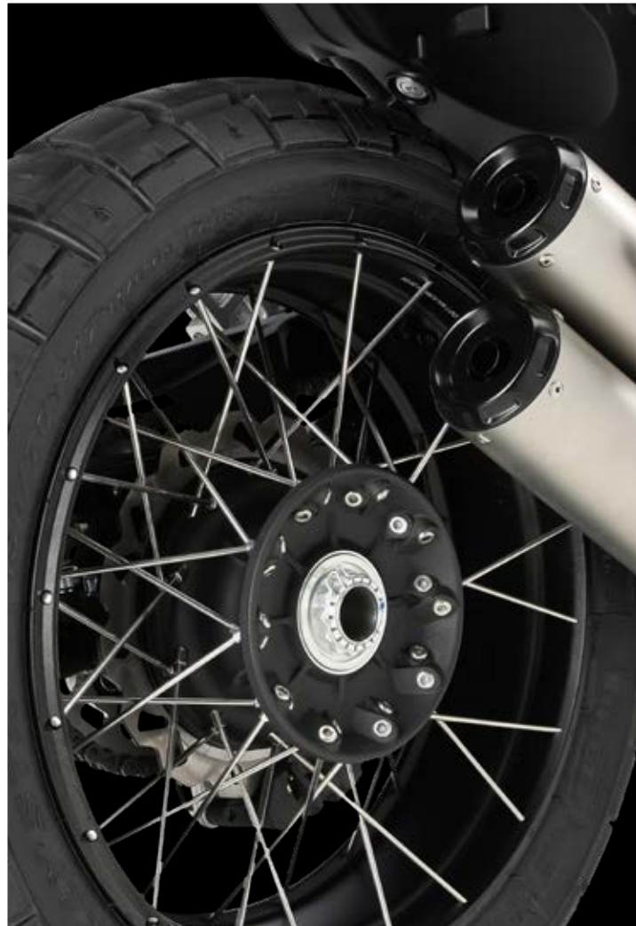
↑ Basculante monobrazo (en ambos modelos SCR/STR)

La Eight Mile es la única Scrambler de media cilindrada con un basculante monobrazo. Un rasgo distintivo que la hace única y diferente, ligera y especial. Cuando la mecánica juega a favor de la belleza, ocurre la magia. ¿Jugamos?