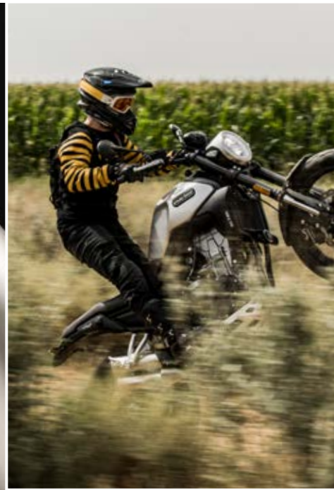
Eight Mile SCR 500 †