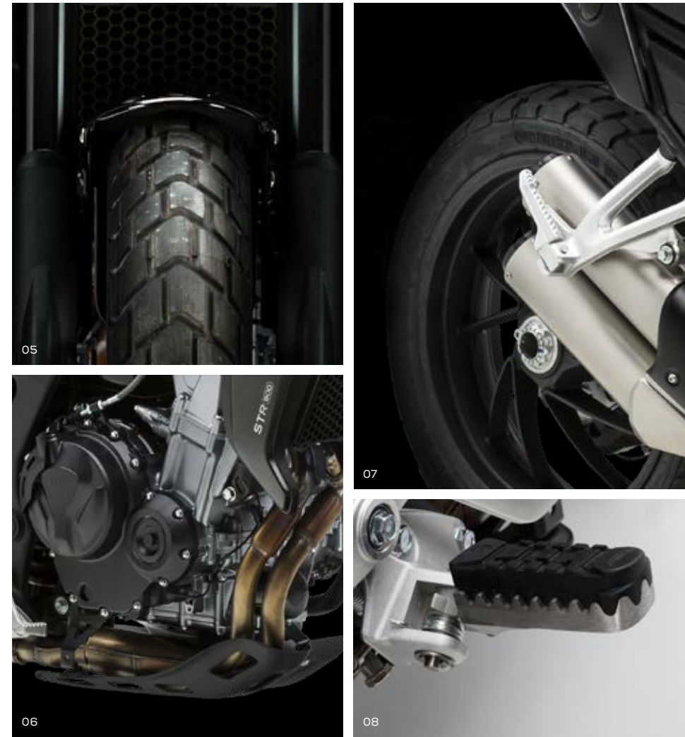
05 Neumáticos PIRELLI MT60 06 Protector de cárter en aluminio pintado negro 07 Llantas de aleación tubeless de aluminio 08 Reposapiés con goma antivibraciones removible